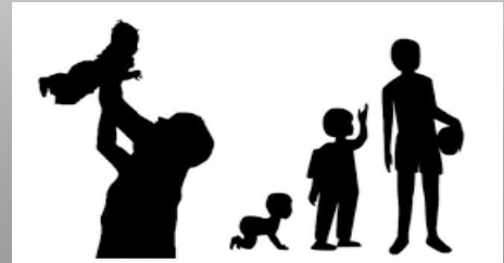
Figuur6 Ontwikkelingsleerlijn baby, dreumes, peuter, kleuter

Samen kunnen we zorgdragen voor een ononderbroken ontwikkelingsleerlijn van baby, dreumes, peuter, kleuter, en verder....zie figuur 6.