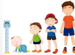
Figuur 3.2 Doorgaande lijn

Bij doorgaande lijnen, zie figuur 3.2, gaat het om een voortdurende ontwikkeling van kinderen door het onderwijs. Het gaat in dit geval om een doorgaande lijn van voorschoolse educatie (in peuterspeelzalen of kinderdagverblijven) naar vroegschoolse educatie (in groep 1 en 2). Deze doorgaande lijn is op verscheidene manieren te realiseren. Hoe dit tot stand komt, is afhankelijk van de visie en methode van de school, de buurt waarin de school staat, en allerlei andere factoren. De doorgaande lijn wordt gekenmerkt door de volgende factoren: