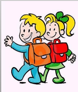
Figuur 3.1 Waardevolle tools in de rugzak van het kind

Kinderopvang Columbus Junior en de auteur zitten in de basis op een lijn, en vullen elkaar aan. Het kind ontwikkelt zich het beste vanuit een liefdevolle en vertrouwde omgeving. Samen (zowel leidsters als ouders) bereiden we het kind voor op de overstap naar de basisschool. Onderweg stoppen we waardevolle tools in de rugzak van het kind, en laten deze de wereld ontdekken, zie figuur 3.1