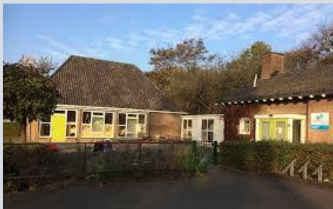
Figuur 2 Kinderopvang Columbus Junior – Vestiging Hofferie

Hierbij is het van belang dat pm'ers en leerkrachten van de basisschool hun aanpak, handelen en aanbod op elkaar afstemmen, dit zorgt voor herkenbaarheid en een natuurlijke overgang van voor- naar vroegschool. Dat is niet alleen een meerwaarde voor de kinderopvang en de basisschool, maar heeft ook een goede overgang tot gevolg van het kind en de ouders van de voorschool naar school. Alle partijen, dus ook ouders en het kind zelf, kunnen eraan bijdragen dat een kind een goede start heeft op de basisschool!