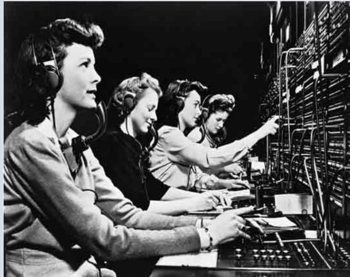
Figuur 1 Telefooncentrale, doorverbinden.

Onderzoek naar de doorgaande lijn van voor- naar vroegschool